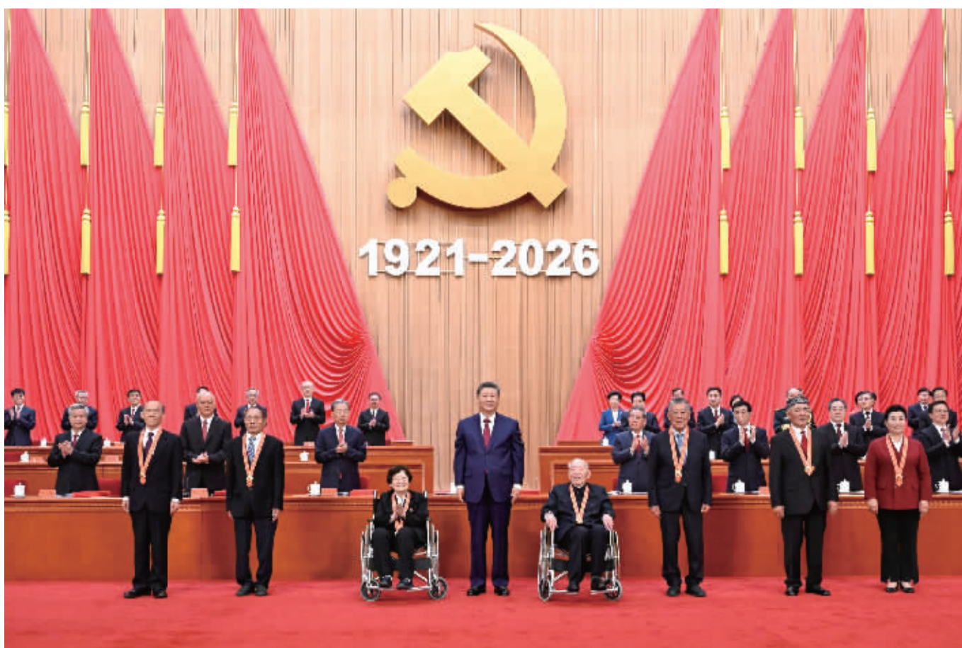
7月1日上午，庆祝中国共产党成立105周年大会在北京人民大会堂隆重举行。中共中央总书记、国家主席、中央军委主席习近平发表重要讲话。