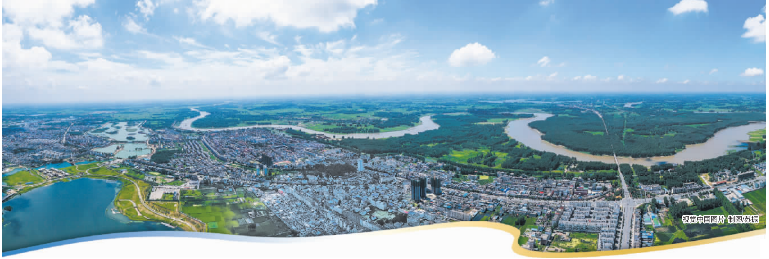
制图/苏振

站在历史时空坐标点上俯瞰淮河,展现在人们眼前的是一幅恢弘磅礴的壮阔图景。淮河串联长江、黄河两大文明脉络,是中华传统文化的核心承载区,更是蕴藏巨大潜力的人文资源富集地。璀璨厚重的淮河文脉,积淀了独树一帜的改革基因、包容格局与创新精神,形成了稀缺的区域人文红利。在新时代高质量发展语境下,重新发掘、整合、活化淮河文化资源,破除文化失语困境、重塑区域文化自信,将沉睡的人文资源转化为产业资源、经济资源、发展资源,已然成为淮河流域突破发展瓶颈、实现全域振兴的关键抓手。