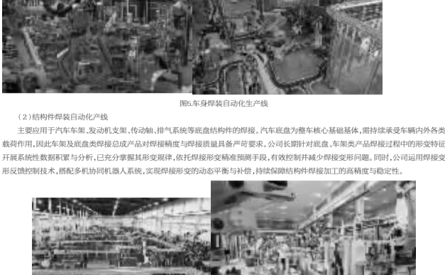
图5.车身骨架自动化生产线

(2) 结构件装配自动化产线 主要应用于汽车车架、发动机盖、传动轴、排气系统等底盘结构件的装配。产线通过高精度机械手、激光定位系统、视觉检测系统等实现高精度装配,提升生产效率,降低人工成本。