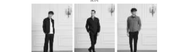
⑤户外系列:原生感的自然色系和天然质感,户外徒步穿搭×时尚设计元素的“机能风”。