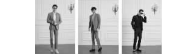
④运动系列:正装加入运动风格,通勤可穿的“高智动感风”。适宜差旅的功能——高弹力、轻薄、便携

③轻、商务系列:此系列以经典的两粒扣西装为主,立体合身的剪裁,收腰修身、轻便、宽松的职场服装,简约、优雅的“静奢风格”。