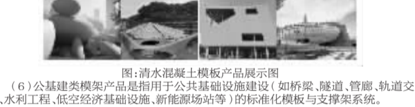
图:清水混凝土模架产品图

(4) 爬升式模架是一种用于现浇钢筋混凝土竖向或倾斜结构施工的自爬升模架系统。其核心特征是通过附着于已浇筑混凝土墙体或结构上的爬升装置,实现模架与支撑架交替爬升,从而逐层完成建筑立面或核心筒等部位的施工。 图:爬升式模架产品图