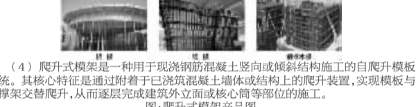
图:铝模、钢模、爬升式模架产品图

(1) 铝模是以铝合金型材为主体,经标准化设计与精密挤压成型的建筑模架系统,专为现浇混凝土结构施工而研发,具有轻质、快速周转、成型精度高、核心工艺等。 (2) 钢模是以优质钢材为核心原材料,经切割、焊接、打磨、防腐处理等工艺加工制成的建筑模架系统,具有强度高、周转寿命长、成型质量稳定与适应性强等优势,是现浇混凝土结构施工中技术成熟且应用广泛的模架类型。 (3) 爬升式模架是以爬升式模架与爬升平台组合而成的建筑模架系统,兼具钢模的刚性与木模的轻便性,适用于中高层现浇混凝土结构。