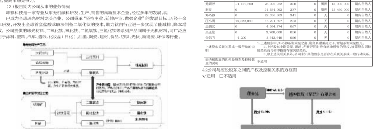
3.1公司主要会计数据和财务指标 3.1近3年的主要会计数据和财务指标 单位:元 币种:人民币

③ 报告期内公司从事的业务情况 坤彩公司是一家专业从事无机颜料研发、生产、销售的高新技术企业,经过多年的发展,现已成为全球珠光材料龙头企业,公司秉承“坚持主业、延伸产业、做深产业链”的发展目标,历经十余年研发,并开发出全球首套盐酸萃取法制备三氯化钛的技术,助力钛白行业进一步实现节能减排、降本增效。公司提供的珠光材料、二氧化钛、氯化物、三氯化钛等产品属于无机材料,广泛应用于涂料、塑料、汽车、造纸、化妆品(日化)、油墨、陶瓷、建材、食品、纺织、光伏、新能源、环保等行业。