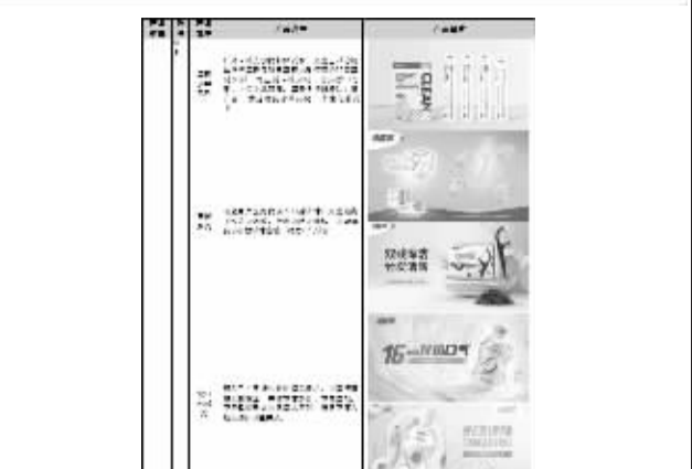
3. 董事会日常工作情况