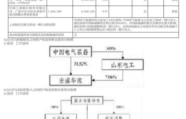
图3 公司与实际控制人之间的产权及控制关系

5. 公司治理 5.1 股东大会 5.2 董事会 5.3 监事会 5.4 独立董事