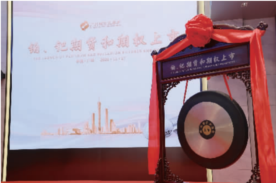
广州期货交易所铂、钯期货和期权上市活动现场

作为绿色发展领域的关键原料,铂、钯在汽车尾气治理、风电及氢能等产业的应用占比分别高达60%和80%,其市场稳定对推动新能源产业发展至关重要。然而,近年来,受地缘冲突、宏观经济波动等多重因素影响,铂、钯价格呈现宽幅震荡态势,产业链上下游企业的风险管理需求日益迫切。在此背景下,广期所铂、钯期货于11月27日9时正式挂牌交易,成为新能源金属期货板块的“新力军”。 铂、钯期货上市首日均推出2606、2608、2610三个月份合约。广期所提供的数据显示,截至11月27日收盘,铂期货成交量达6.67万手,持仓量0.76万手,成交额292.31亿元;钯期货成交量3.42万手,持仓量0.27万手,成交额130.49亿