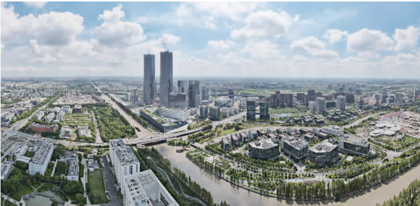
空中俯瞰位于上海浦东新区的张江科学城。