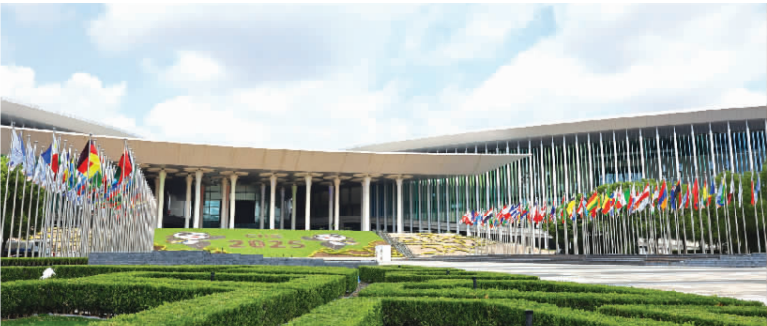
2025年10月5日拍摄的进博会举办场所——国家会展中心（上海）外景。