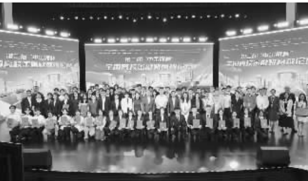
活动结束后全员大合影

据悉,下一步,中金所将持续与各证监局、各兄弟交易所投保部门、行业协会携手,强化使命担当,汇聚共识,形成合力,共同推进金融服务国民教育相关工作,为金融强国、教育强国建设贡献更多资本市场力量。