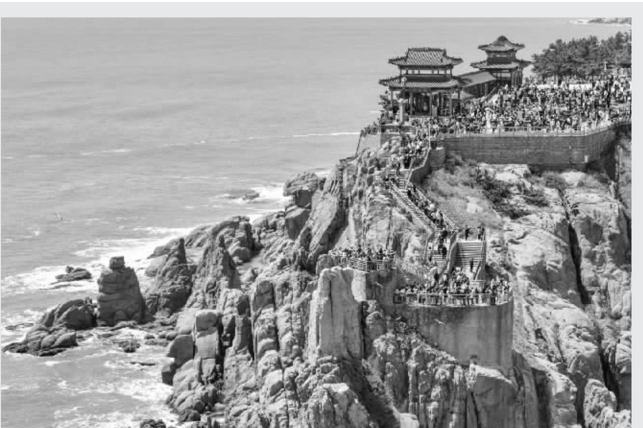
图为5月3日游客在山东省荣成市成山头风景区游览（无人机照片）。