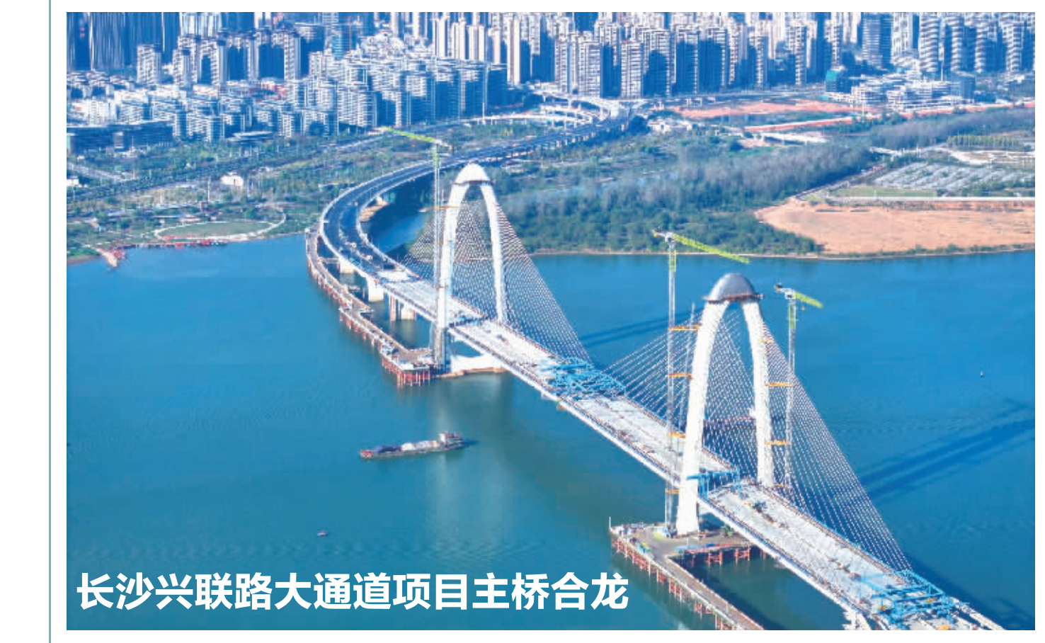
长沙兴联路大通道项目主桥合龙

这是11月8日在长沙兴联路大通道项目建筑工地拍摄的双塔斜拉桥主桥施工现场(无人机照片)。当日，由长沙市交通投资控股集团有限公司投资建设、中交一公局集团承建的长沙兴联路大通道项目主桥中跨合龙段钢梁吊装完成，标志着项目关键控制性工程双塔斜拉桥主桥合龙，项目全线贯通。