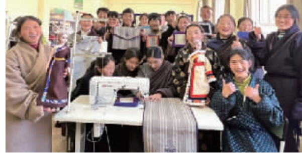
ME创新计划支持的“筑梦高原”乡村青年非遗赋能项目

凰网“年度行动者联盟”特别贡献奖、和讯网榜样公益项目、搜狐十大优秀公益项目等殊荣。《我们和ME的故事》年度主题视频,还获得中国公益电影节企业类优秀作品奖。