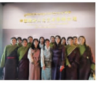
ME创新计划支持的多杰旦民族职业技术学校

“知识改变命运,打造长效教育帮扶”,这一理念得到了ME创新计划的支持。为了帮助学校更好地运转,培养孩子们成长、成才,ME创新计划支持多杰旦民族职业技术学校开展了“筑梦高原”非遗技艺创新助力乡村振兴项目,以民族美术、民族服装设计为依托,从采购培训物资到邀请发达地区同专业高水平教师开展线上线下课程培训,再到选拔该校优秀教师“走出去”,前往发达地区接受培训。为该校两专业带来全方位提升,让牧区孩子们不仅“有学