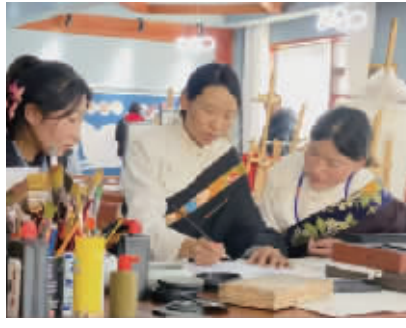
ME创新计划支持的困境乡村青年就业帮扶项目