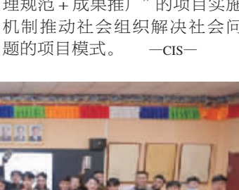
ME创新计划支持的多杰旦民族职业技术学校

数据显示,“ME创新计划”已累计提供超过1亿元资金,带动超过2800家社会组织参与项目申报,支持216个公益项目进行创新迭代,推动解决相关问题,形成了一套通过支持社会组织公益创新实践,以“资金资助+创新支持+影响提升+管理规范+成果推广”的项目实施机制推动社会组织解决社会问题的项目模式。 —cis—