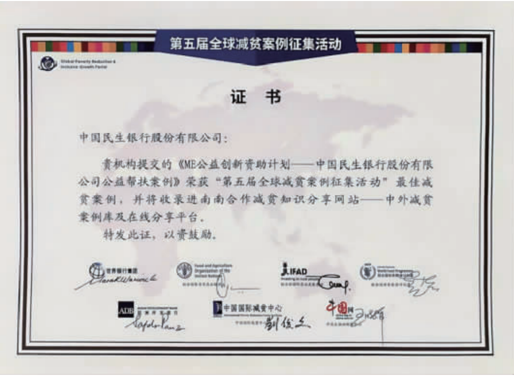
中国民生银行“ME公益创新资助计划”获评“第五届全国最佳减贫案例”证书

民生银行还通过ME创新计划,积极拓展人人可参与、人人可公益的渠道。该行成立敏捷小组,发动全行超过200名员工成为ME公益志愿者,鼓励分行参加当地公益项目,支持员工走进乡村和社区,深入参与乡村振兴,并进一步带动客户、公众参与公益实践。