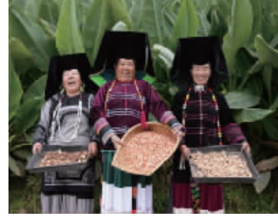
ME创新计划支持的“阿妈的药园”乡村振兴妇女“领头雁”项目