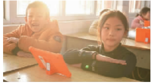
ME创新计划支持的“一扇窗”乡村儿童数字素养项目

供资金超1亿元,惠及31个省(区、市),308个县(市),169个市(自治州),受益人包括外来务工人员、心智障碍群体、残障群体、留守儿童、乡村中小學生等,项目直接受益人数达37.4万人次。经过多年的持续运行,民生银行ME创新计划获得了业内外的充分认可。近年来,多次获