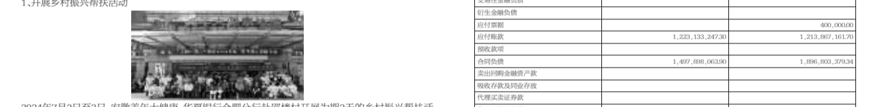
2024年7月2日至3日, 安徽美年大健康、华夏银行合肥分行赴庐江县开展为期两天的乡村振兴帮扶活动, 安徽美年大健康为百名脱贫群众、老弱病残村医和村小小学教师开展了专场免费体检活动, 并走进结对帮扶对象家中, 送去米面油粉等慰问品, 与村民交流询问生产生活状况、子女教育情况等, 详细了解他们的困难需求, 鼓励他们进一步树立信心, 还向村小捐赠足球、篮球、羽毛球等体育用品, 开展卫生健康和急救知识培训。

(二) 社会责任情况 报告期内, 公司积极履行企业社会责任, 凭借自身在医疗健康领域的专业优势, 关注全民健康, 积极参与乡村振兴计划, 通过多次赴乡村地区开展免费体检、义诊、捐赠、公益健康讲座活动, 为公益事业发展贡献美年力量。 1. 开展乡村振兴帮扶活动