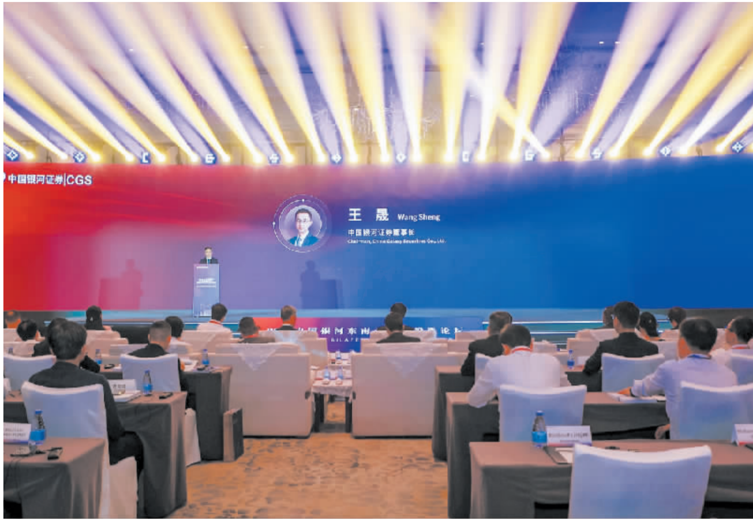
2024中国银河东南亚双向投资论坛”现场

此外,继2023年发布《“一带一路”金融合作实践东盟专题报告》之后,本次论坛上,中国银河证券又带来了《中国+东盟:制胜公式》,深入分析中国和东盟的政策、贸易和经济,为两地企业了解彼此投资环境和机会,促进双向投资提供了参考。