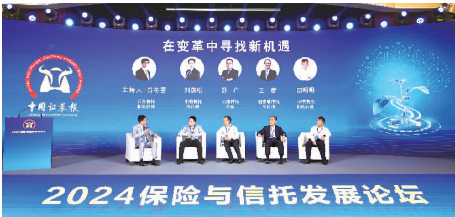
9月6日,由中国证券报主办的“锚定五篇大文章 培育新质启未来”2024保险与信托发展论坛在大连举行。