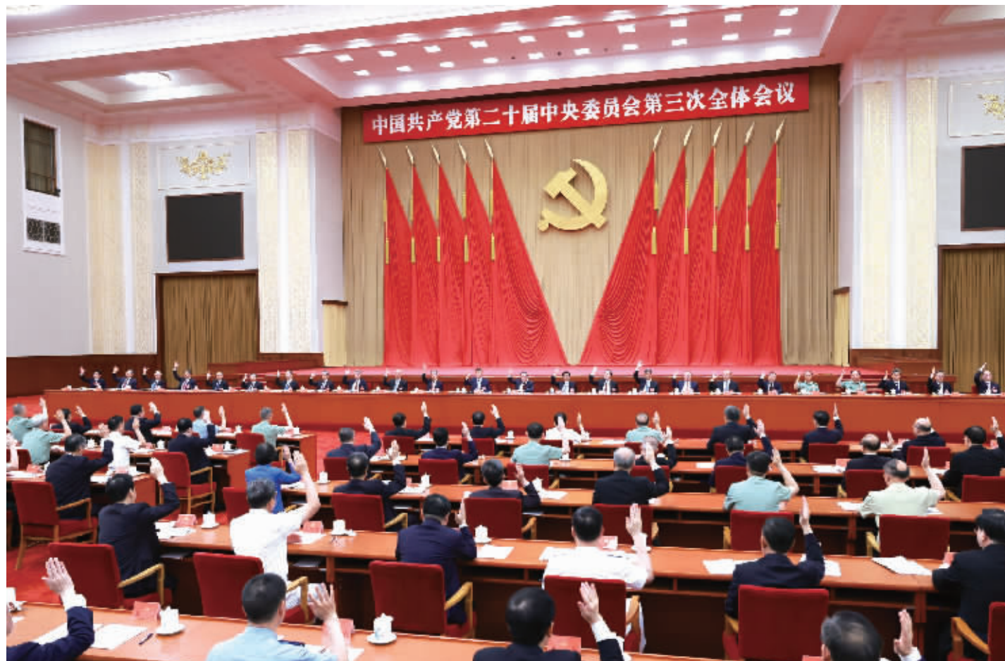
▲中国共产党第二十届中央委员会第三次全体会议，于2024年7月15日至18日在北京举行。中央委员会总书记习近平作重要讲话。