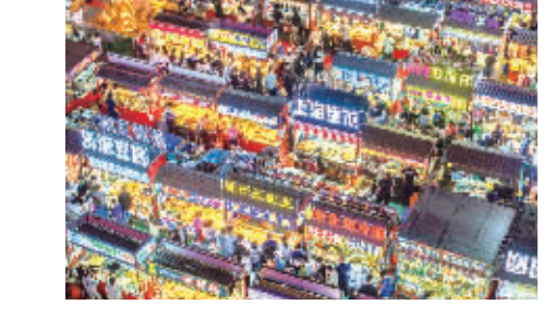
文旅融合烟火气 点亮城市“夜经济”