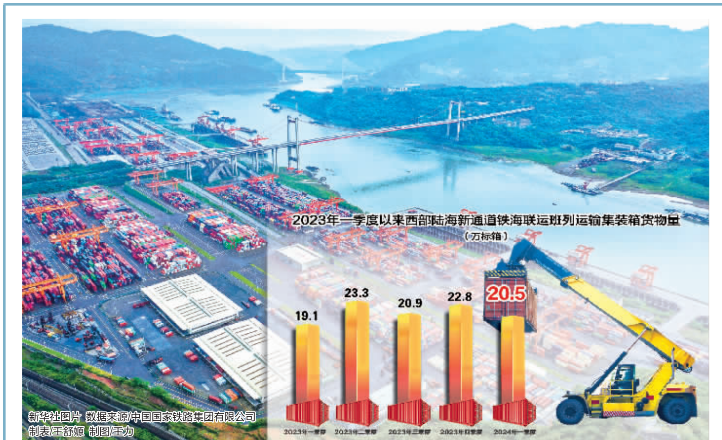
新华社图片 数据来源/中国国家铁路集团有限公司 制图/王舒媛

中智管理咨询有限公司相关负责人说，国有企业应主动应对全球产业链重组、深度参与国际产业链分工，在信息通信、新能源、高端装备制造等领域发挥先导性和引领性作用，加大国有资本投入和占比。(下转A02版)