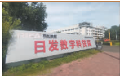
日發精機疑似配合 控股股東敏感時點减持