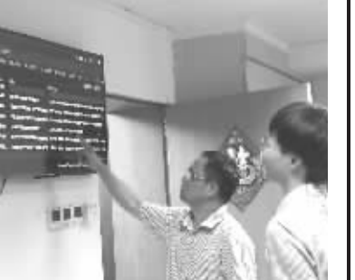
图2:东莞证券党员同志研究分析统一监控平台系统运行情况

“合规、诚信、专业、稳健”是证券行业文化理念的体现,是资本市场长期稳定健康发展的价值取向。东莞证券将继续坚持党建引领促司建,始终坚守“党建引领”的鲜明方向,积极在行业文化理念引领下,认真对照证券行业文化“十要素”要求,坚持守正创新,大力探索前沿技术在运营业务的管理应用,提升数字化、智能化运营水平,将党建工作与行业文化建设深度融合、形成合力,夯实企业良好的红色文化根基,推动行业文化建设行稳致远,不断增强高质量发展的韧性和动力。(文/万宇)