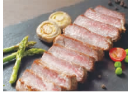
▲味知香明星产品黑椒牛排