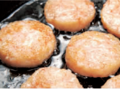
▲味知香明星产品虾饼