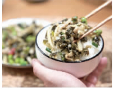
▲味知香明星产品雪菜肉丝