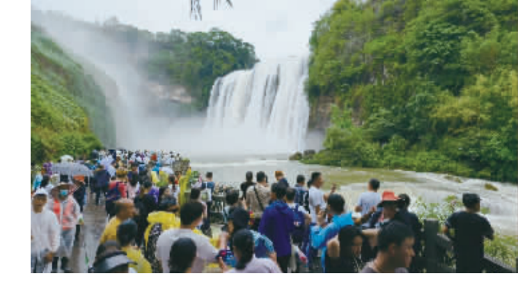
今年暑期，黄果树瀑布迎来大批游客。

国信证券表示，随着需求持续复苏，民航业将由供大于求逐步向供需平衡乃至供不应求过渡，运价水平有望持续强势。