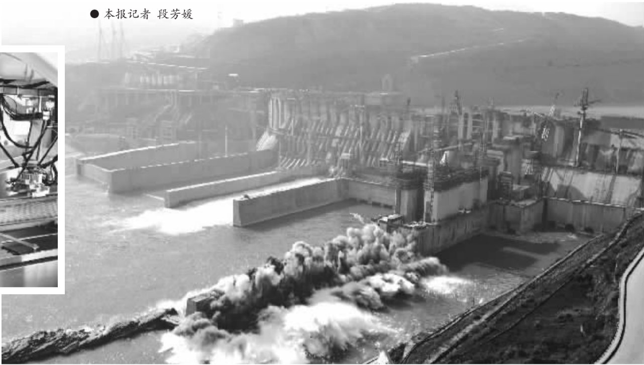
易普力实施的水电站爆破现场