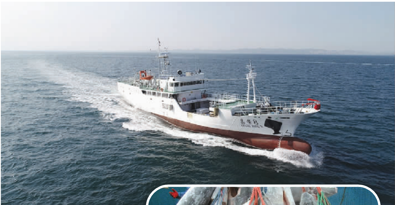
中水渔业远洋捕捞作业现场。 公司供图