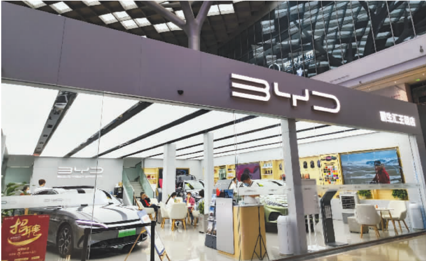
比亚迪王朝系列合生汇门店