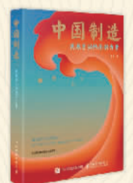
《中国制造：民族复兴的澎湃力量》 曾纯著 人民邮电出版社

推荐语： 该书以细致入微的文笔生动描摹出中国近百年社会变迁、世态人情的雄浑画卷。从粤港吃茶点的习俗生发开来，不仅将古语今展现了中国自古以来宏博精深的饮食文化，且深刻探讨了在时代变幻、家国危难之际，饮食是如何安抚人心、凝聚起中国人的精气神的。