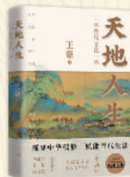
《天地人生：中华传统文化十章》 王蒙著 江苏人民出版社

推荐语： 该书以翔实的史料和宏大的叙事手法，展示了中国海权从“自在”到“自为”的海洋史话，阐述了中华民族是世界上最早向海图强的民族之一，讲述了中国古代的海洋实践活动及其辉煌。