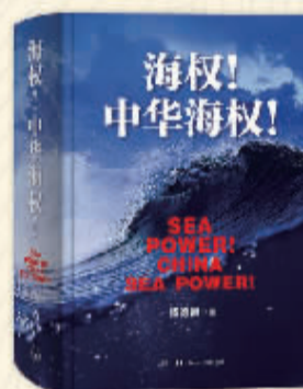
《海权！中华海权！》 杨德昌著 生活·读书·新知三联书店

推荐语： 这是一部忠实记录庆祝中国共产党成立100周年大会珍贵影像的画册，是新华社关于建党百年系列庆祝活动图片报道的集锦。画册收录的175幅照片精选自新华社播发的近千幅建党百年系列庆祝活动照片，包括“庆祝大会”“颁授仪式”“文艺演出”三个部分，为历史留下精彩瞬间、永恒记忆，体现了新华社献礼建党百年的特殊重要意义，是我们党光辉历程中的重要文献资料，具有重要出版价值和典藏价值。