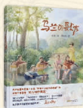
《马兰的歌声》 徐鲁 文 葛双双 图 安徽少年儿童出版社

推荐语： 该书以伊莎白亲眼看见、经历、参与的中国人民从站起来到富起来、强起来的百年人生故事，展现了中国百余年发展历程，特别是中国共产党为中国人民谋幸福、为中华民族谋复兴的伟大历程。