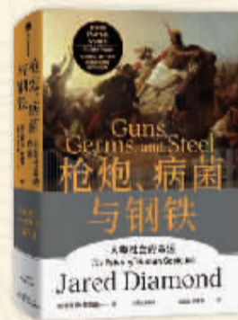
《枪炮、病菌与钢铁：人类社会的命运》 [美]贾雷德·戴蒙德著 中信出版集团

推荐语： 该书明确提出随着经济的发展，中国的城镇化率会继续增长，服务业在GDP和就业中所占比重也会进一步提高。全书以“在集聚中走向平衡”的理念为基础，从活力、宜居与和谐三个目标切入，探讨了城市发展的现状、规律与未来，有助于读者读懂中国城市化的未来方向。