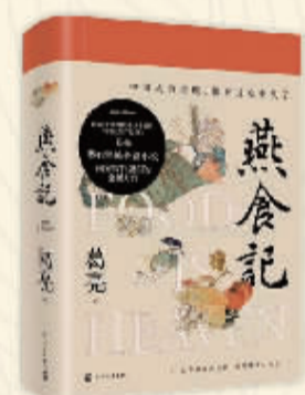
《燕食记》 葛亮著 人民文学出版社

推荐语： 该书试图提供“最近13000年来所有人的简短历史”，但并不只是描述过去的历史；它试图解释为何欧亚文明最终可以存活下来并战胜其他文明，同时驳斥欧亚霸权是由欧亚知识分子或道德上的优越而来。