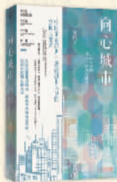
《向心城市：迈向未来的活力、宜居与和谐》 陆铭著 上海人民出版社

推荐语： 该书围绕生死、天地、三才、混一、文治、修身、美德、君子、劝学、风度十大中国传统文化核心话题，揭示其中的中厚内涵与深远意义，探寻国人价值观、思维方式、生活准则的源头，溯源古代文化中至今依然对人类生活不乏启迪的内涵。