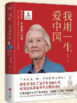
《我用一生爱中国：伊莎白·柯鲁克的故事》 遥桦著 天地出版社

推荐语： 该书用一幅幅精美震撼的插画来描绘远古时代的自然场景和场景中的精灵鬼怪，还原上古的海势地貌，让最本真的远古自然呈现眼前。每张插画均有山海经文字注解，对传统文化进行了通俗易懂的解说。