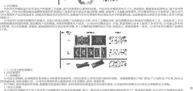
滁州多利汽车科技股份有限公司总部大楼