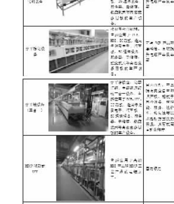
(2) 通用五金电镀领域