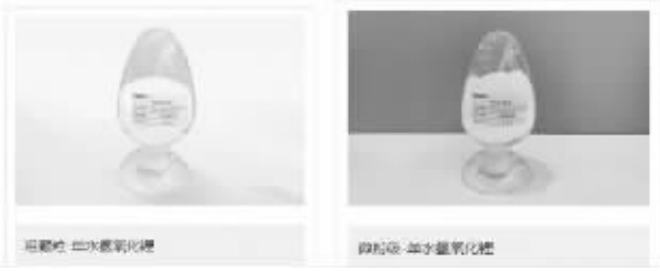
氢氧化锂 二次重氧化锂 碳酸锂 二次重氧化锂

1、新能源锂电材料主要包括氢氧化锂、碳酸锂产品,主要应用于新能源汽车电池、通讯电子产品电源设备、能源存储等领域,是锂离子电池主要的正极材料原材料供应来源。