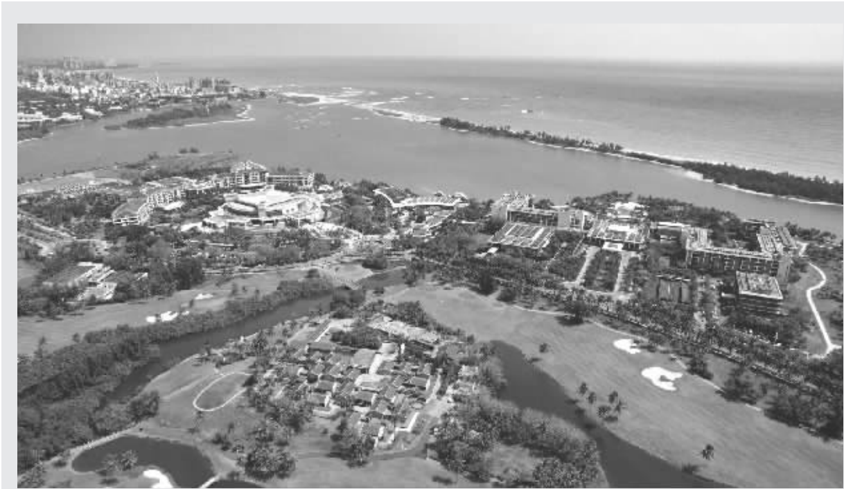
航拍博鳌零碳示范区（无人机照片）。位于海南省琼海市博鳌镇的博鳌零碳示范区建设取得阶段性成果，一期工程16个项目已建设完成,其余项目将于博鳌亚洲论坛2024年年会前完成,并全面实现零碳运行。