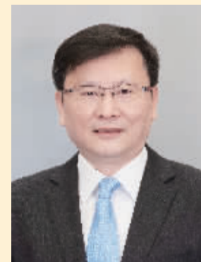
招商证券总裁 吴宗敏

很荣幸能够获奖，感谢中证报和金牛奖评委会的认可，也感谢广大投资者对招商证券的信任与支持。