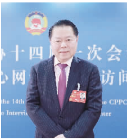
全国政协委员 丁佐宏

数据显示,国内免税市场的全球占比逐年提升。2023年春节假期,海南海口的离岛免税购物金额和人数同比分别增长5.88%和9.51%,与2021年同期相比分别增长51.5%和64.9%。而这一增长态势在未来