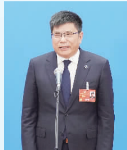
全国政协委员 戴斌