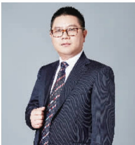
全国政协委员 王均金

近年来,我国新能源汽车市场在国家政策扶持、市场引导、技术进步、用户体验提升等因素共同推动下,呈现爆发式增长。新车交强险统计数据,2022年全国有超过40个城市新能源汽车渗透率超过30%,主要集中在一二线城市及部分经济发展水平较高的东部沿海地区。整体而言,当前新能源汽车发展地区不平衡,高渗透率城市发展已相对成熟,增长势头有所放