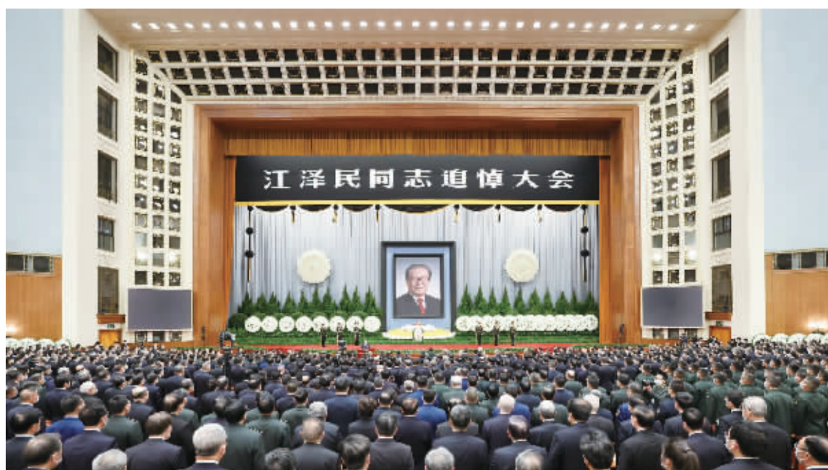
12月6日,中共中央、全国人大常委会、国务院、全国政协、中央军委在北京人民大会堂隆重举行江泽民同志追悼大会。