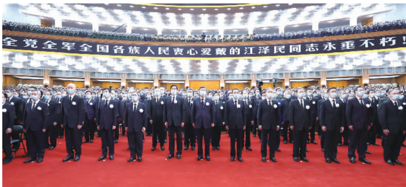
12月6日,中共中央、全国人大常委会、国务院、全国政协、中央军委在北京人民大会堂隆重举行江泽民同志追悼大会。习近平、李克强、栗战书、汪洋、李强、赵乐际、王沪宁、韩正、蔡奇、丁薛祥、李希、王岐山等参加大会。