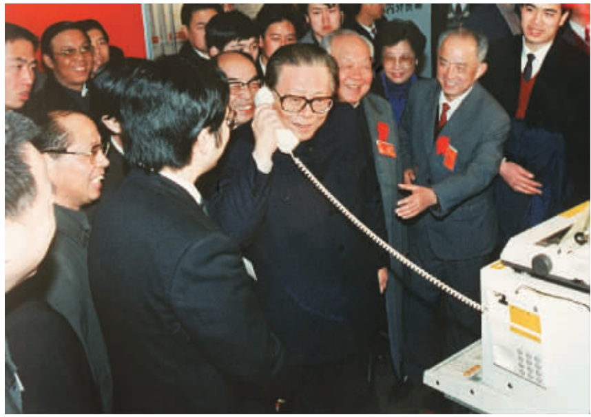
▲ 1984年5月,江泽民同志在北京展览馆举行的全国电子新产品展览会上,试用国际长途电话向远方的工作人员问候。