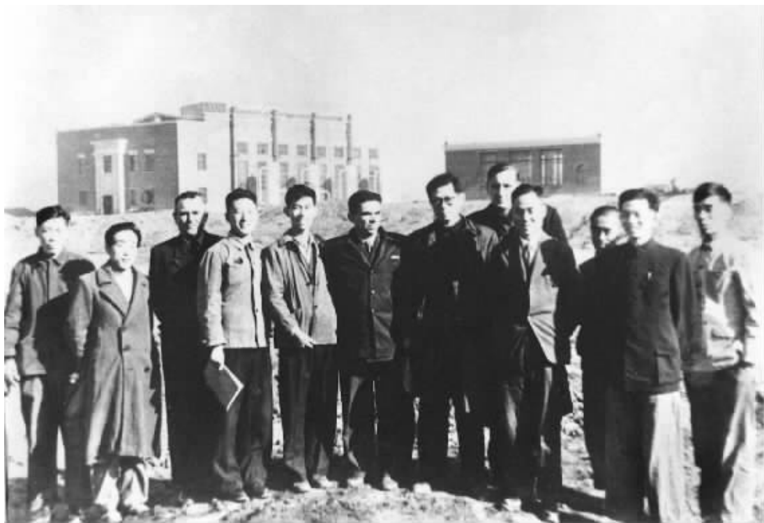
▲ 1956年,江泽民同志(左七)在长春第一汽车制造厂同援建一汽的苏联专家等合影。