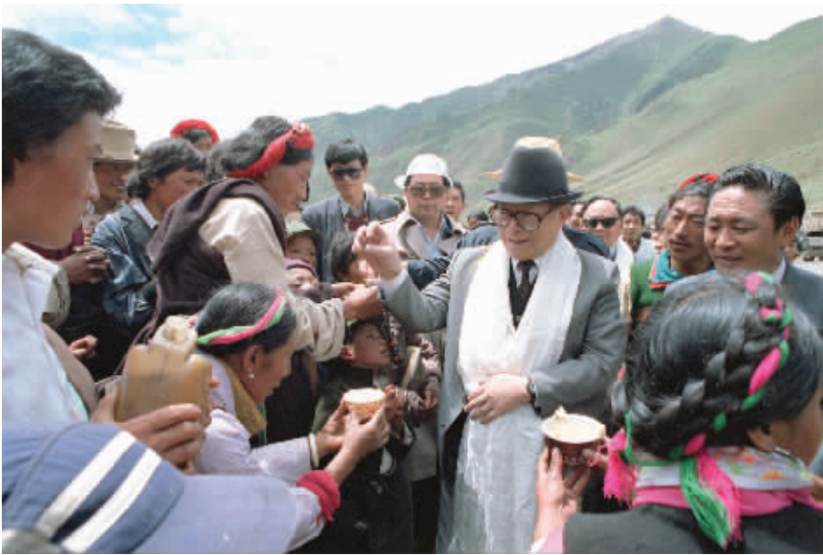
▲ 1990年7月25日,江泽民同志与藏族群众共庆望果节。