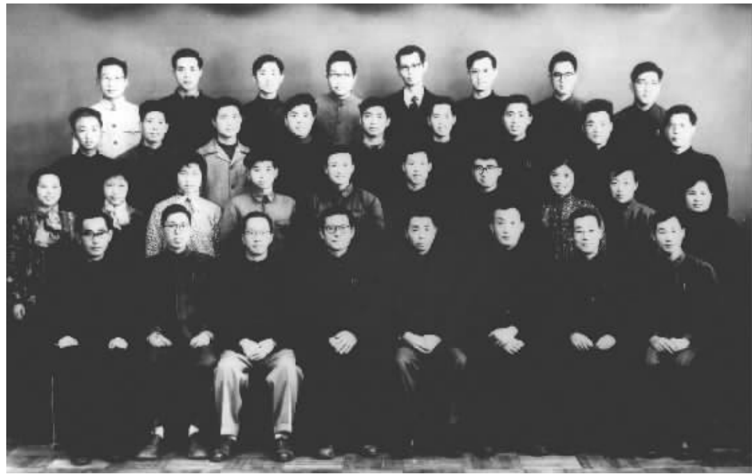
▲ 1963年3月,江泽民同志(前排右五)在上海同小型三相异步电机全国统一系列设计领导小组成员合影。