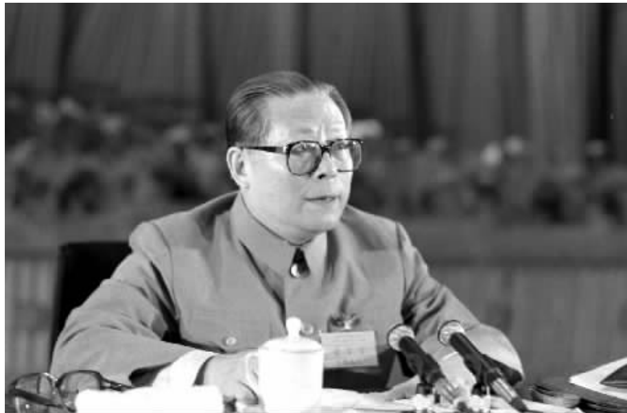
▲ 1989年6月23日至24日,中国共产党第十三届中央委员会第四次全体会议在北京召开。这是江泽民同志在会上讲话。 ► 1989年11月6日至9日,中国共产党第十三届中央委员会第五次全体会议在北京召开。这是邓小平同志和江泽民同志亲切握手。