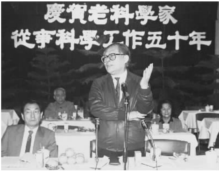
▲ 1988年10月,江泽民同志在上海庆贺老科学家从事科学工作五十年座谈会上讲话。