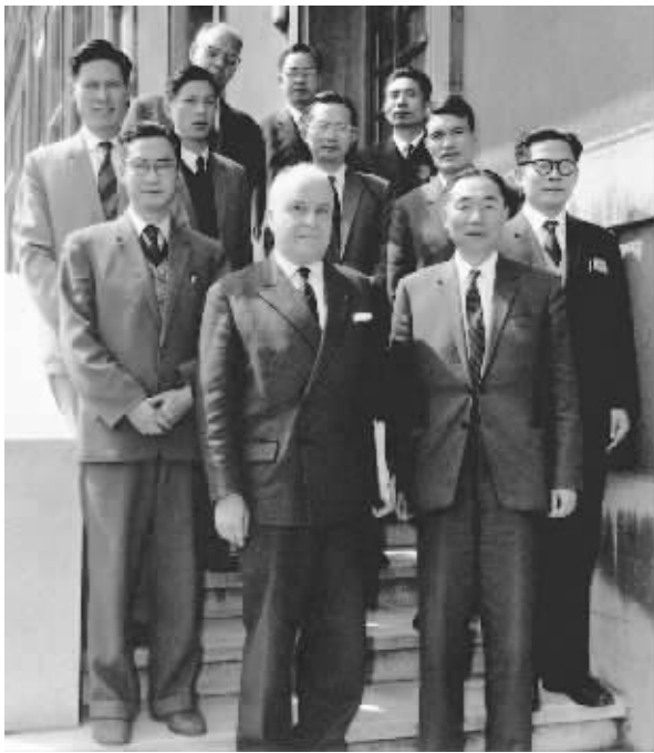
▲ 1964年6月,江泽民同志(二排右一)在法国艾克斯莱班出席国际电工委员会会议期间与会代表合影。