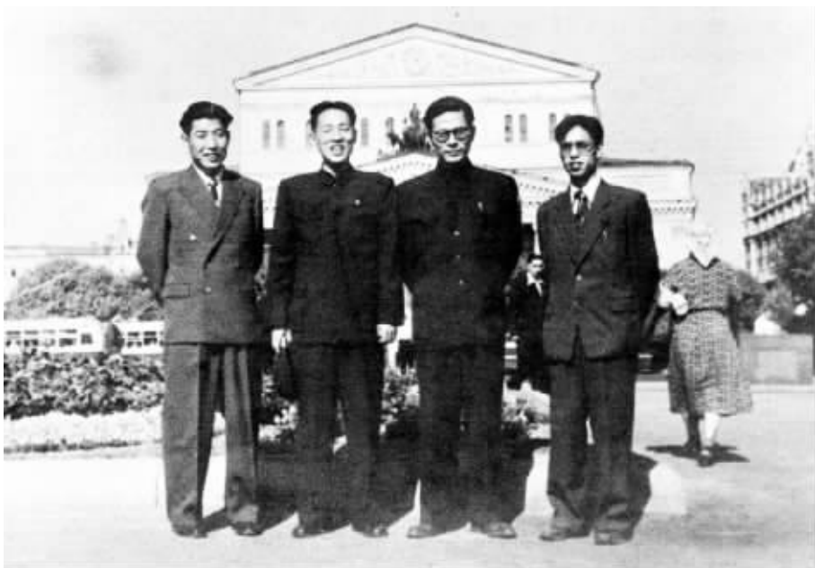
▲ 1955年至1956年,江泽民同志(右二)曾在莫斯科斯大林汽车制造厂实习。这是江泽民等在莫斯科合影。 ◀ 这是1947年江泽民同志在上海交通大学的毕业照。