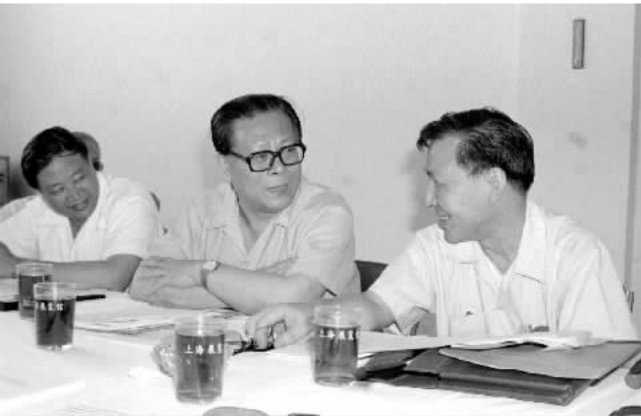
▲ 1985年,江泽民同志在上海市八届人大四次会议上。