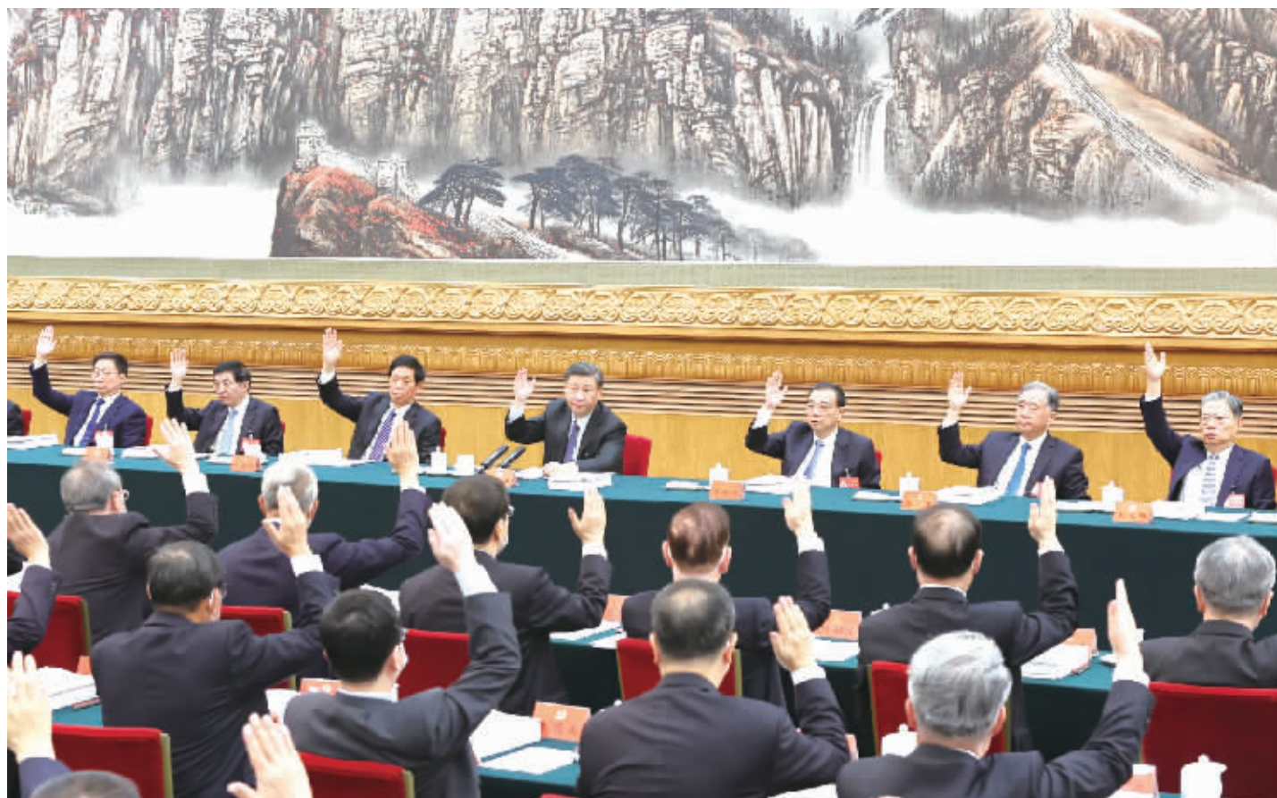
10月21日,中国共产党第二十次全国代表大会主席团在北京人民大会堂举行第三次会议。习近平、李克强、栗战书、汪洋、王沪宁、赵乐际、韩正等出席会议。

新华社北京10月21日电 中国共产党第二十次全国代表大会主席团21日上午在人民大会堂举行第三次会议,通过二十届中央委员会、候补中央委员和中央纪委检查委员会委员候选人名单(草案),提交各代表团酝酿。 习近平同志主持会议。 会议通过了经各代表团差额预选产生的二十届中央委