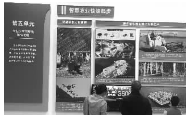
参观者驻足在智慧农业展区前。

种植业方面,我国设施蔬菜规模已扩大至3000万亩以上,结构装备科技水平稳步提高,蔬菜生产保供能力显著提升。畜牧业方面,大型生猪、蛋鸡、肉鸡