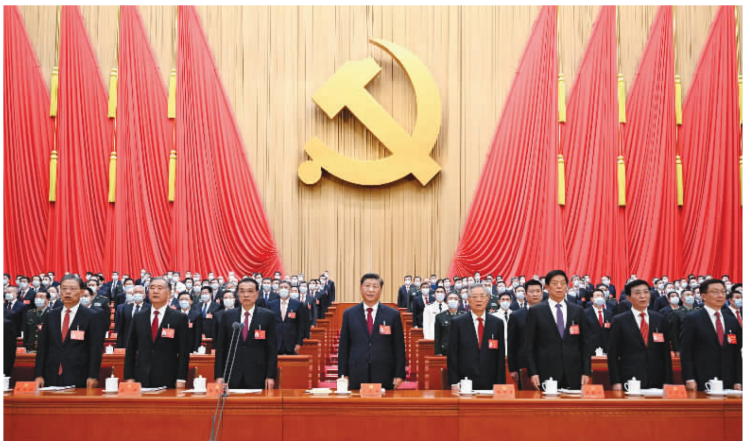
10月16日,中国共产党第二十次全国代表大会在北京人民大会堂开幕。这是习近平、李克强、栗战书、汪洋、王沪宁、赵乐际、韩正、胡锦涛在主席台上。

新华社北京10月16日电 凝心聚力擘画复兴新蓝图,团结奋进创造历史新伟业。举世瞩目的中国共产党第二十次全国代表大会16日上午在人民大会堂开幕。