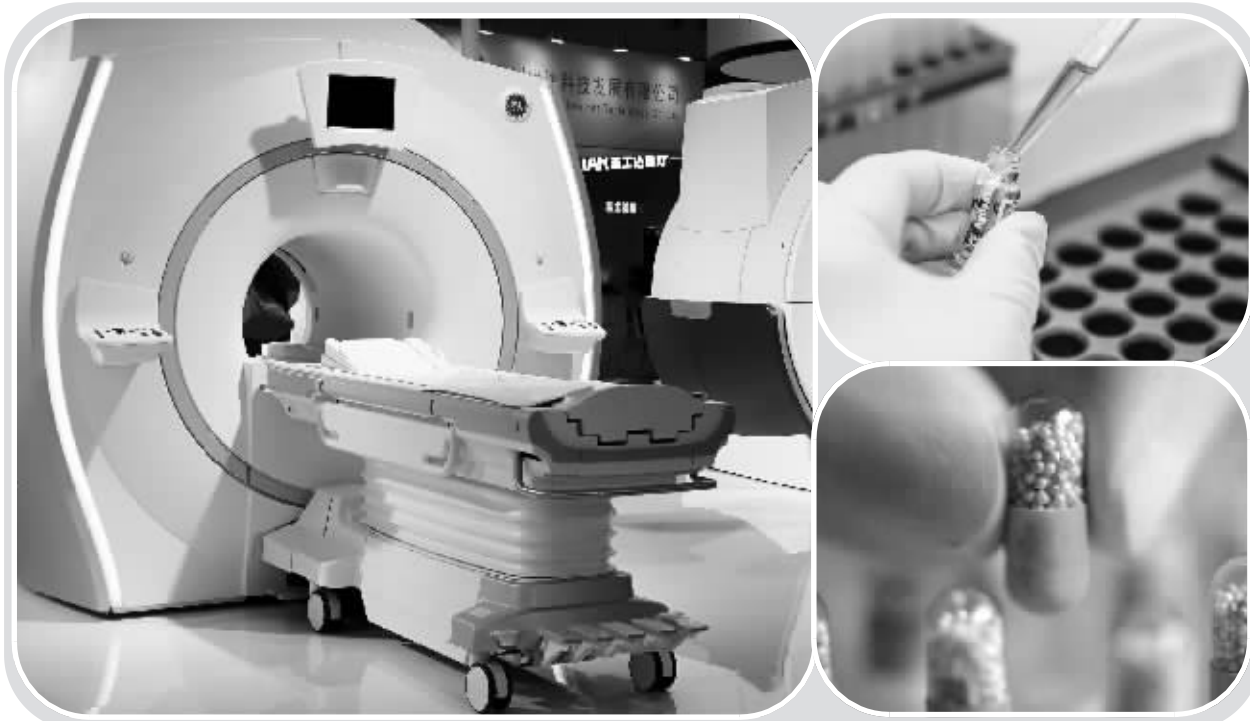
机构投资者持股较为集中的行业