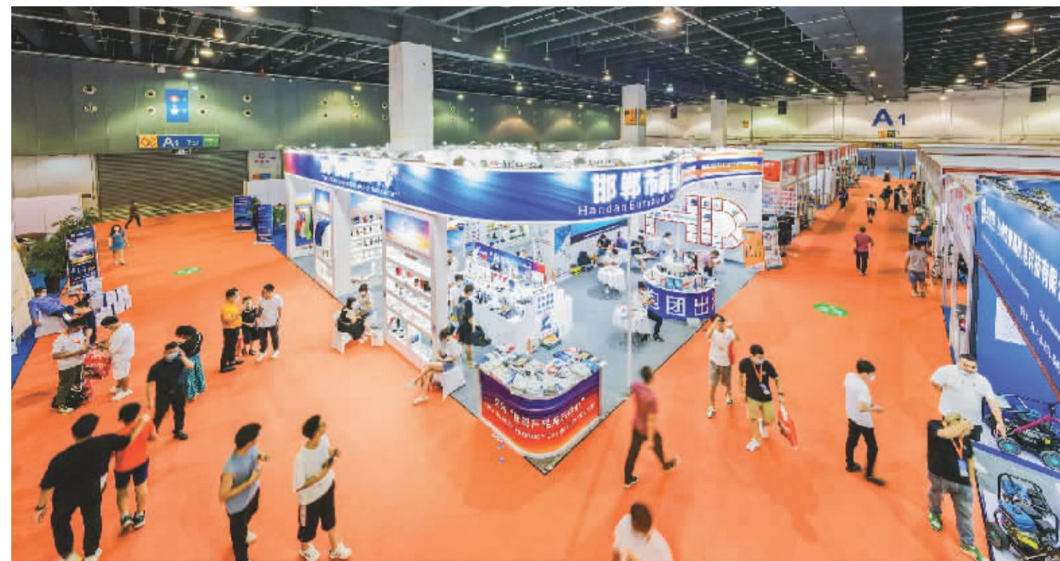
第6届中国义乌国际五金电器博览会现场