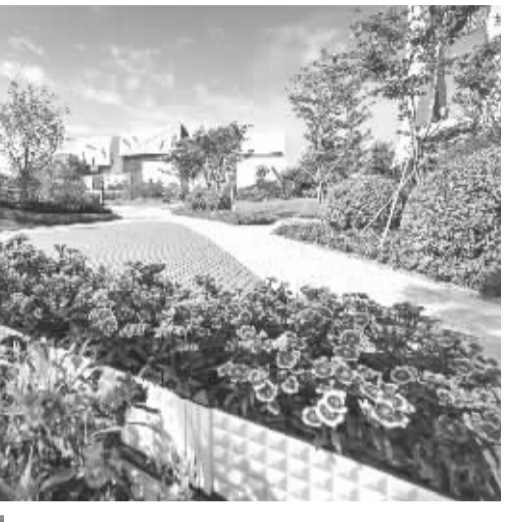
瀚蓝南海固废处理环保产业园一角