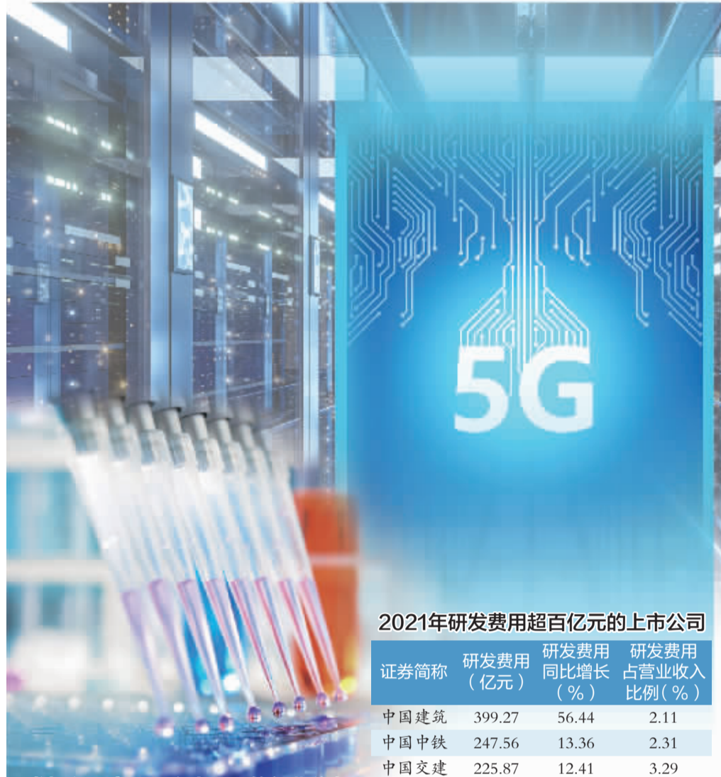
研发投入强度10%以上公司的行业分布

青岛啤酒2021年公告拟建立研发创新基地,总投资为3.8亿元,并成立了全资子公司青岛啤酒科技研发中心。公司研发人员从上年披露的62人增加到本期的629人,研发费用同比增长43.90%。青岛啤酒介绍,2022年初公司新研发上市的艺术典藏超高端产品青岛啤酒“一世传奇”引领了国内啤酒产业消费升级的新高度。