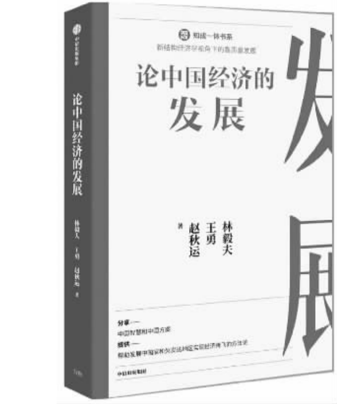
书名:《论中国经济的发展》 作者:林毅夫 王勇 赵秋运 出版社:中信出版集团

具体来看,本书论述了新结构经济学自主理论创新的发展脉络,包括梳理中国经济学科走向自主创新的过程,突出现代经济学的结构革命,这