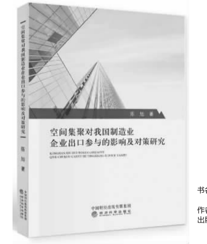
书名:《空间集聚对我国制造业企业出口参与的影响及对策研究》 作者:陈旭 出版社:经济科学出版社

为此,本书在企业异质性贸易理论框架下,分析空间集聚的外部经济效应和拥挤效应对企业出口二元边际的动态影响,并基于企业出口的视角对我国各地区是否存在过度集聚的现象进行实证检验与分析。本书作者认为,首先,尽管我国空间集聚对制造业企业出口二元边际的影响呈先扬后抑的“倒U型”趋势,但目前我国绝大多数城市的集聚程度远远低于最适强度。特别是资本和技术集中程度较高的东部地区,需要进一