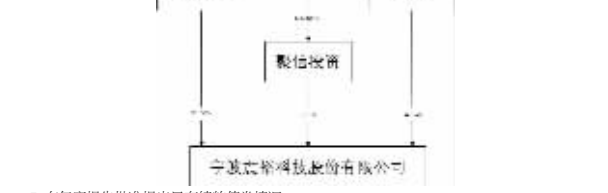
宁波宸裕科技股份有限公司

5.在年度报告批准报出日存续的债券情况 □适用/√不适用 三、重要事项 1.经中国证监会证券监督管理部备案,宸裕科技股份有限公司公开发行股票上市的批复(证监许可[2021]354号)同意宸裕科技公开发行人民币普通股(A股)2,327.00万股,每股面值100元,每股发行价格为人民币28.77元,募集资金总额为人民币66,947.79万元,扣除相关发行费用后实际募集资金净额为人民币59,618.09万元。