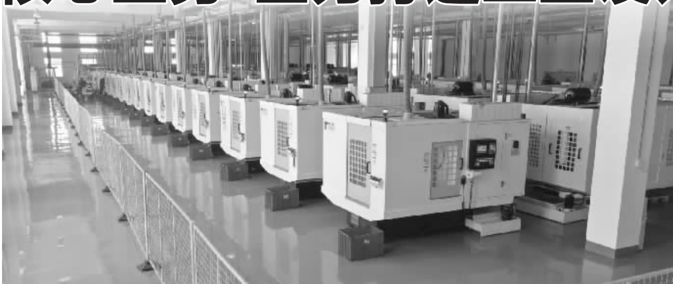
配天智造无人工厂车间

公开资料显示,配天智造成立于2006年,是在新三板挂牌的国家高新技术企业。公司立足于中高挡数控系统自主研发,提供标准和定制的工业自动化