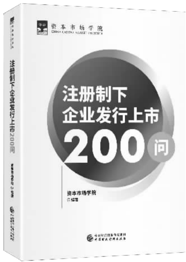
书名：《注册制下企业发行上市200问》 作者：资本市场学院 出版社：中国财政经济出版社

在新的市场形势下，拟上市公司、中介机构等市场参与方要高效规范地完成发行上市，就需要全面、深入、精准地把握注册制相关要求及监管理念。近期，由资本市场学院组织华泰联合证券、中信证券、中信建投证券和中金公司四家券商资深投行人员共同编著的《注册制下企业发行上市200问》，全面汇集了头部券商执业过程中遇到的重点、难点问题以及经验心得，并请相关监管部门专家在全书框架和问题设计上给予了精心指导，阐释注册制下发行上市相关规则、要求，并辅以案例。书中所列问题具有普遍性、代表性，是一本兼具全面性、权威性和实操性的注册制发行上市指南。