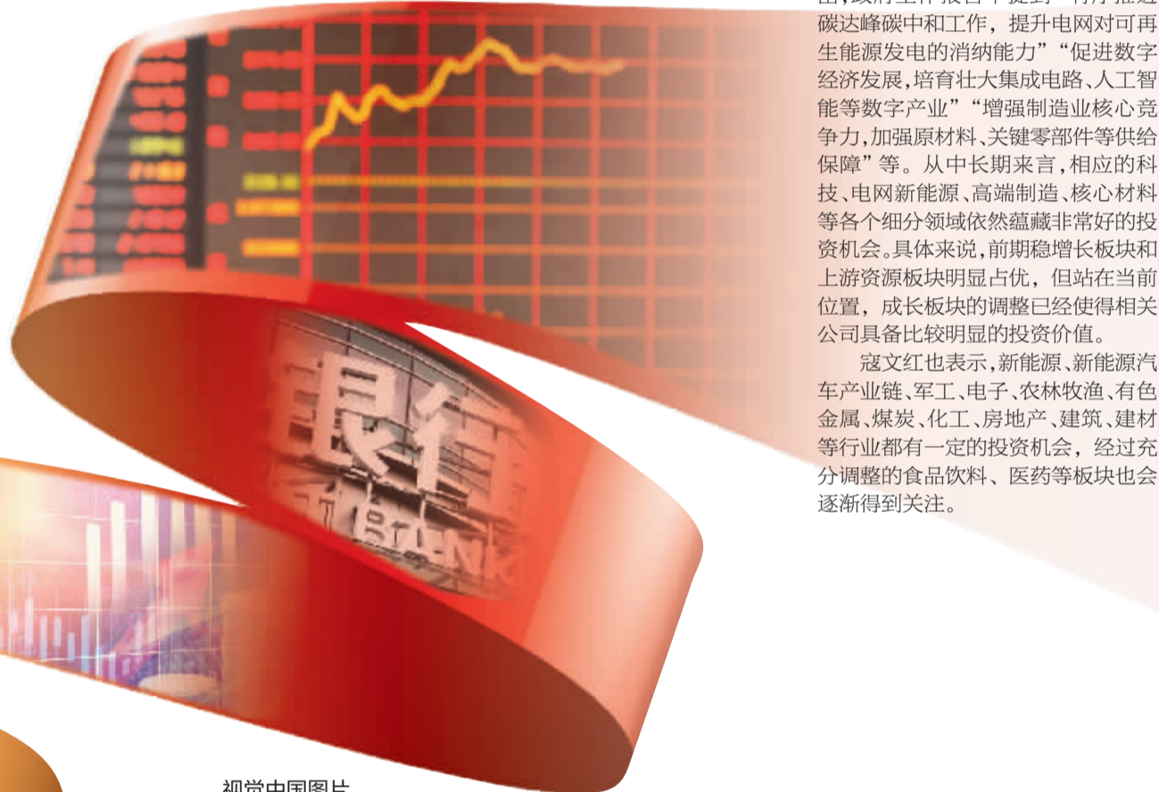
视觉中国图片制图/韩景丰