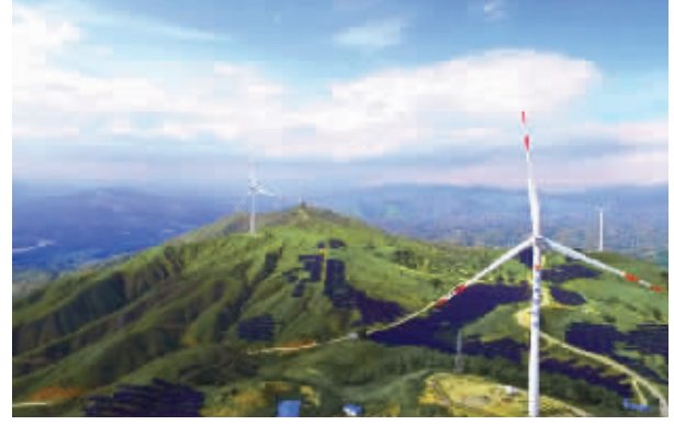
左图:甘肃玉门鑫能50兆瓦熔塔塔式光热电站 右图:隆基股份单晶电池生产工序 右图:川能动力盐边大面山风电项目

电流澎湃 新项目不断落地 四川甘孜州雅江县,一座295米世界级高土石坝——两河口水电站横跨雅砻江,稳稳地嵌入V字形峡谷中。站上大坝,风声呼啸。湍急的河流如巨龙奔腾,汇成高峡平湖,再从高处俯冲而下,驱动巨大的发电机轰然作响,源源不断地为华中、华东等地输送电力。 沿着雅砻江探访,中国证券报记者发现,江水蜿蜒,大量的风力发电机、光伏电站错落分布在山水田野间。专家表示,雅砻江流域的甘孜州、凉山州、攀枝花市地处风能和太阳能资源富集区域,流域沿岸风电、光电资源可开发量逾4000万千瓦。 “我们最大的特点是水风光互补,目标是建设综合性的清洁能源基地。”全面负责雅砻江梯级水电站建设和管理的雅砻江流域水电开发有限公司负责人说,水电是基石,风电和光伏发电是不稳定的电源,但通过两河口等水库的优化调度和水电机组的快速调节,可以“打捆送出”,有效破解风能、太阳能开发和消纳难题。(下转A03版)