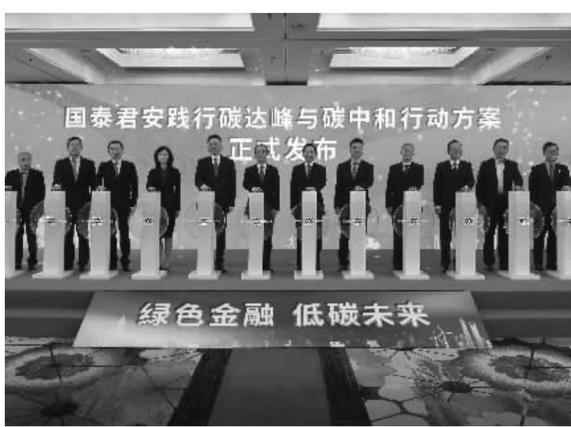
国泰君安发布《践行碳达峰与碳中和行动方案》