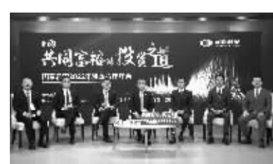
国泰君安举办“走向共同富裕的投资之道”资本市场云端年会