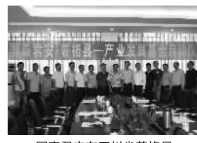
国泰君安在四川省普格县设立农业产业帮扶基金